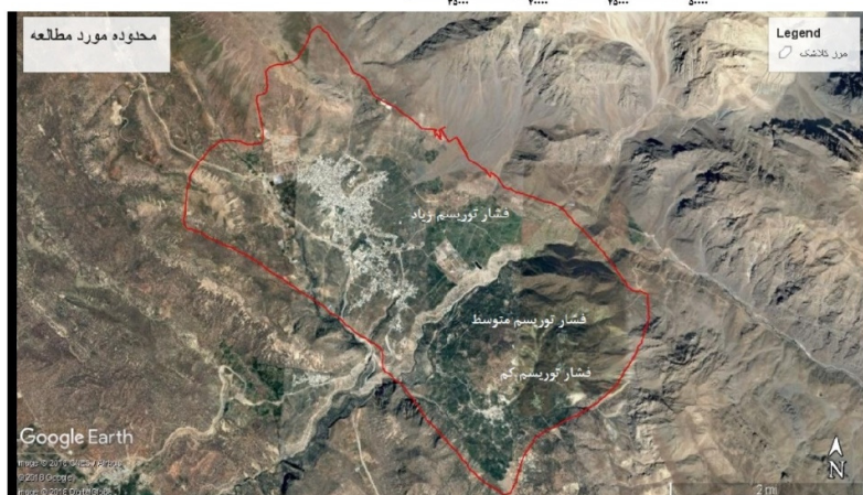
شکل ۱: منطقه مورد مطالعه